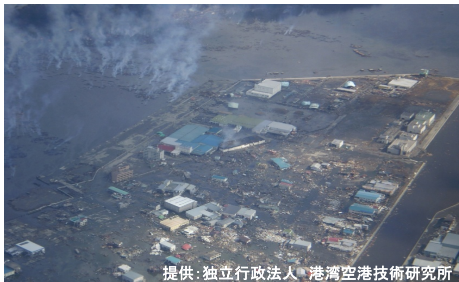
気仙沼港 港口の流出油による海上火災