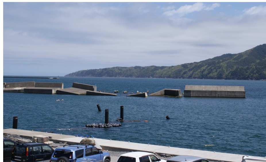
宮古港 神林地区 波除堤の崩壊