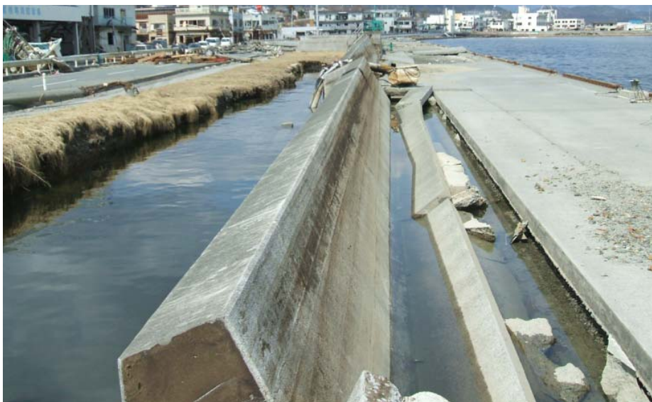
大船渡港 茶屋前地区 防潮堤の倒壊