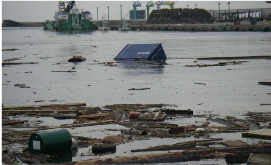
石巻港 釜地区 中央水路 漂流物による航路埋塞