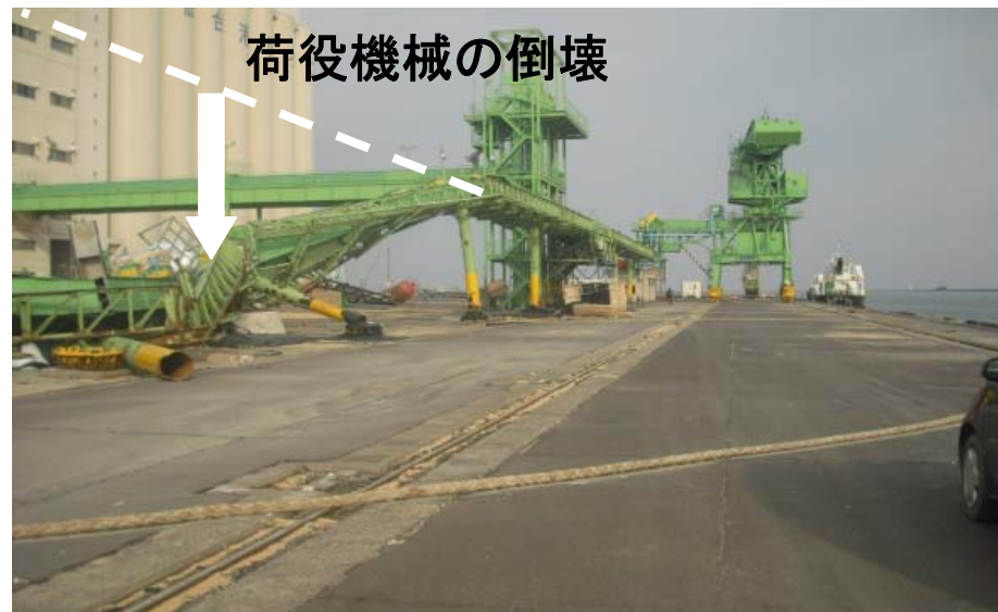
仙台塩釜港 中野地区 1号岸壁(-12m)背後 荷役機械の倒壊