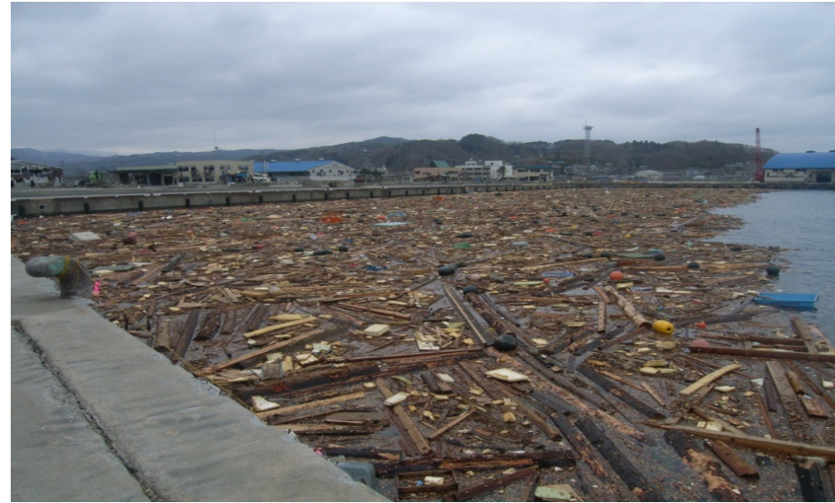
宮古港 藤原地区 岸壁前面を埋め尽くすガレキ