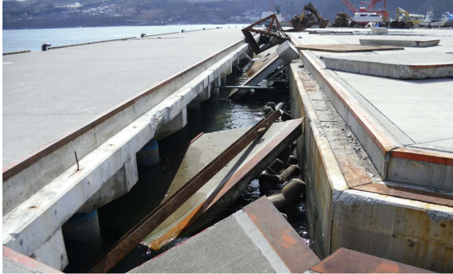
久慈港 諏訪下地区 岸壁の損壊(渡版の落下)