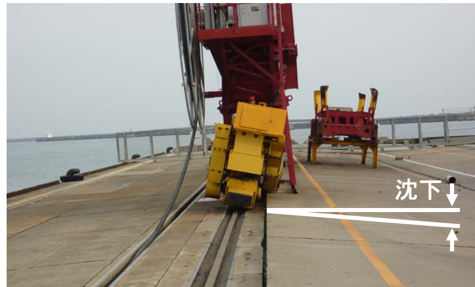
小名浜港 大剣ふ頭地区 2・3号岸壁(-10m)の荷役機械の損壊