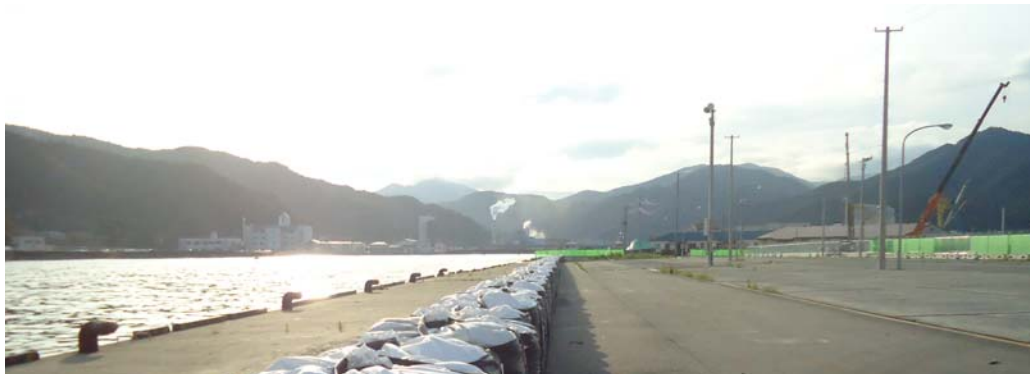
釜石港 須賀地区(干潮時)