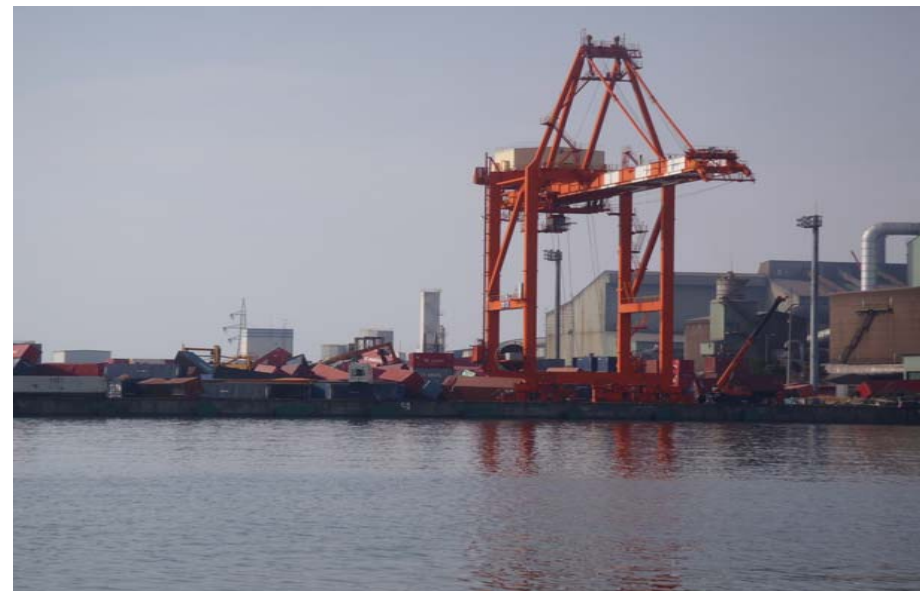
高砂コンテナターミナル岸壁(-14m)のコンテナ散乱