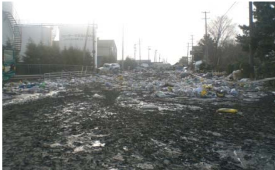
石巻港 釜地区 臨港道路釜北線 瓦礫により通行不能