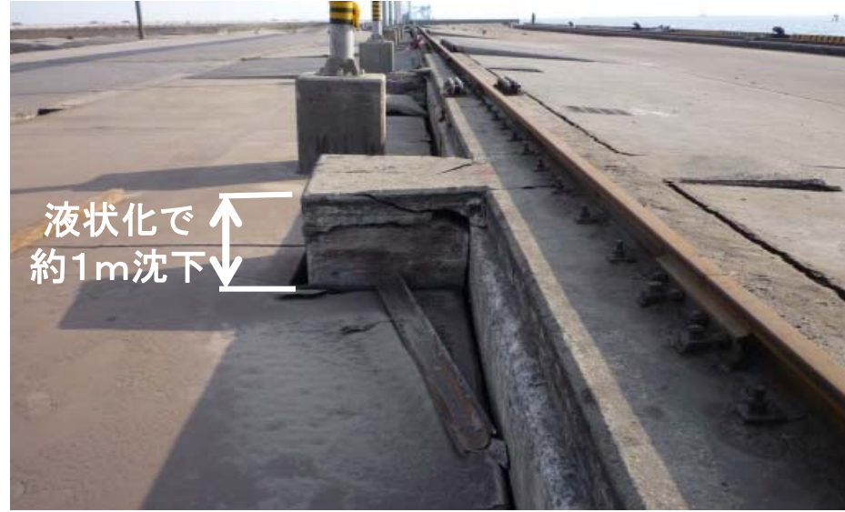
小名浜港 3号ふ頭 岸壁の液状化で荷役機器レール付近の沈下