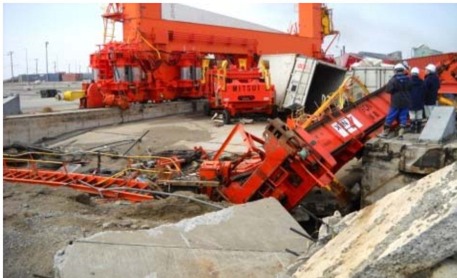
仙台塩釜港 高砂コンテナターミナル岸壁(-14m)の荷役機械の損壊