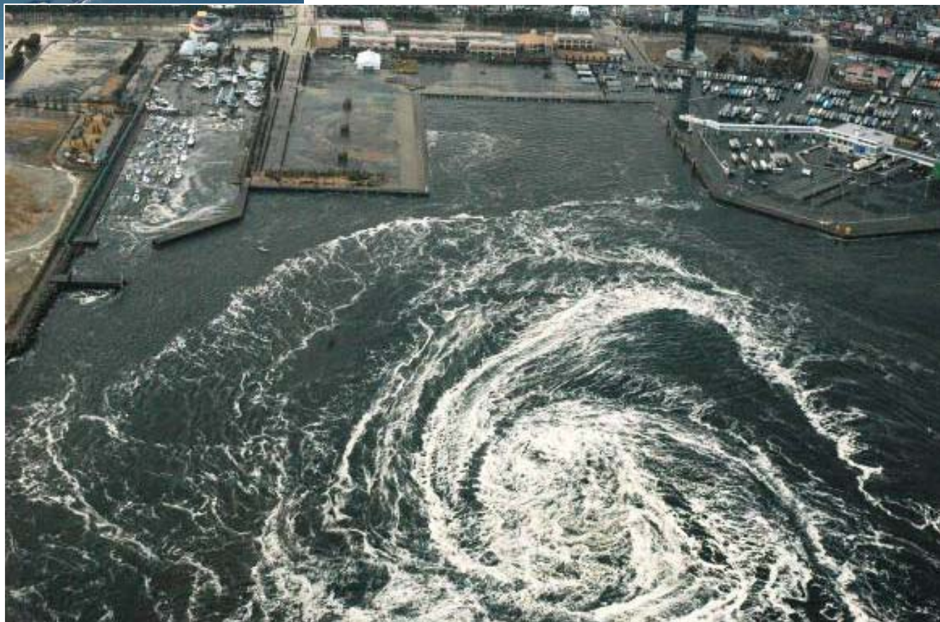
渦潮発生時の様子