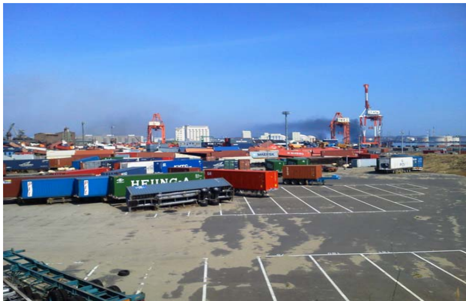
高砂コンテナターミナル岸壁(-14m)の背後ヤードのコンテナ散乱