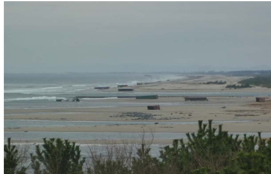
津波により漂流し、高砂ふ頭背後の砂浜に打上げられたコンテナ4