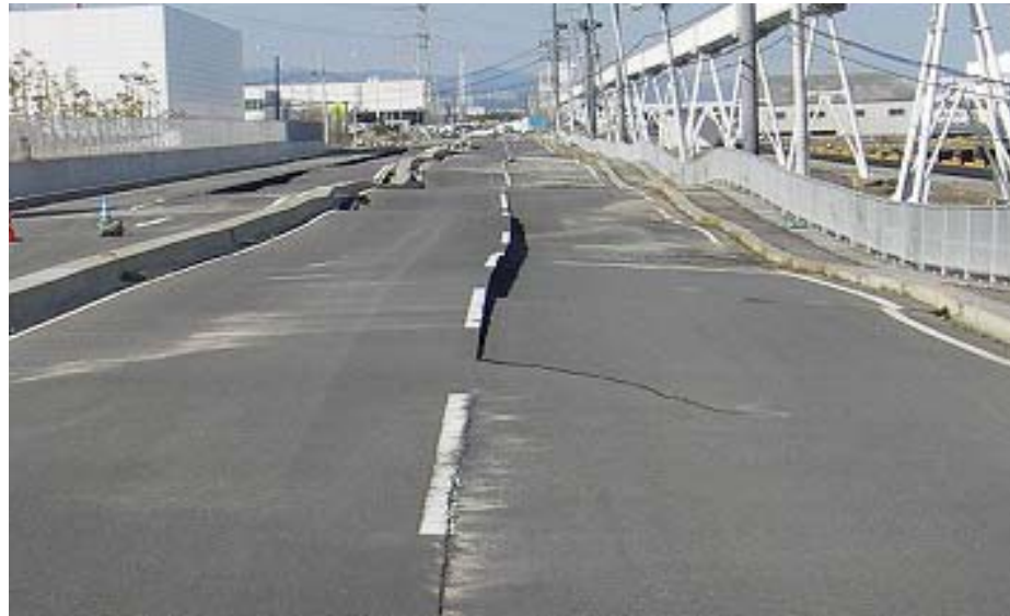
茨城港 常陸那珂港区 臨港道路5号線 液状化による損壊