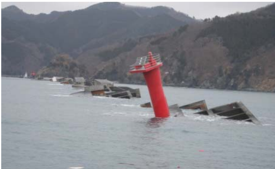
釜石港 湾口防波堤(北堤(延長990m))ほぼ全壊