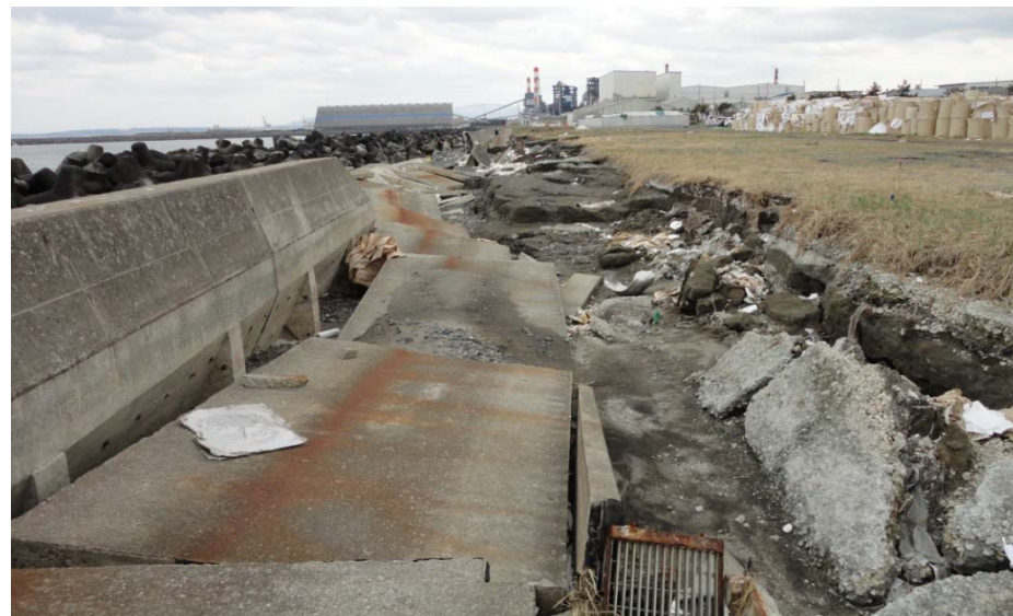
八戸港 八太郎地区 護岸の倒壊