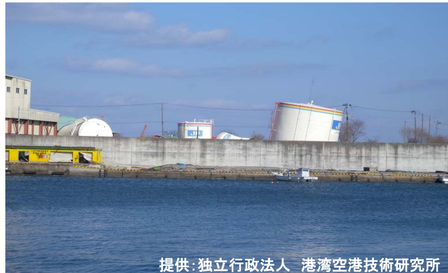
久慈港 転倒した石油タンク