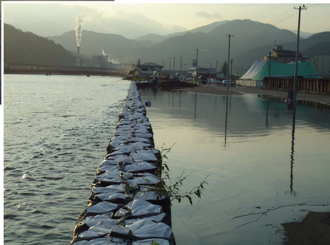
釜石港 須賀地区(満潮時)