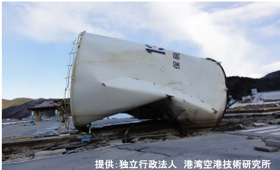
気仙沼港 壊れた石油タンクと油漏れ