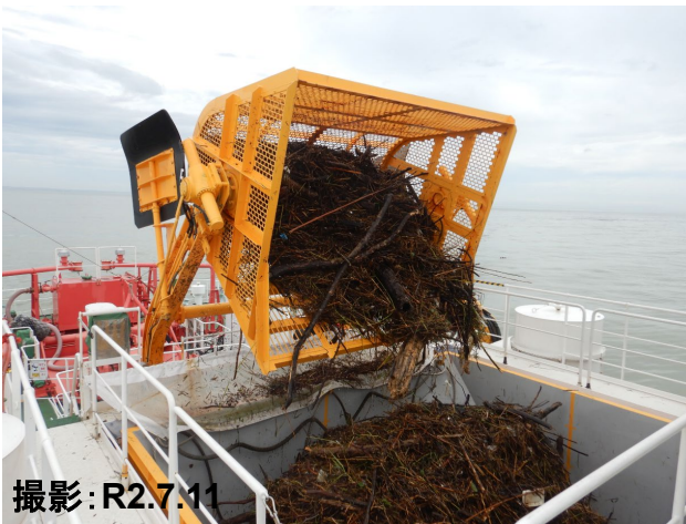
スキッパーによる流木等回収状況