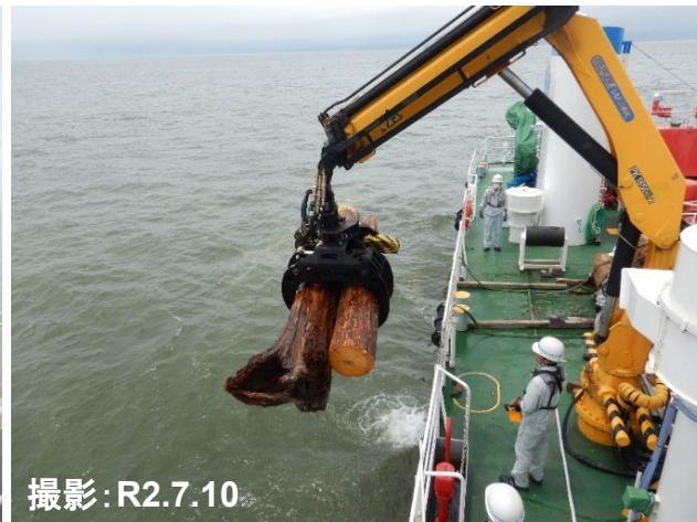
クレーンによる流木の回収状況