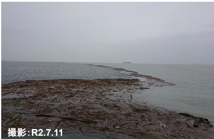
潮目に集まる漂流物