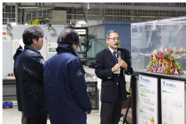
消波ブロックの波消し効果を模型で説明