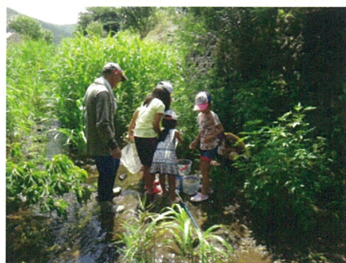
川に入って調査をしている状況