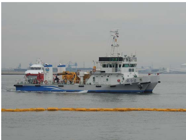
(訓練海域で排出油防除訓練中の白龍)