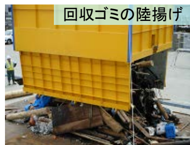
回収ゴミの陸揚げ