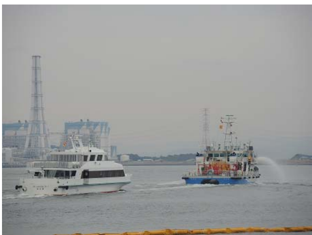
(訓練海域を航行中の白龍)