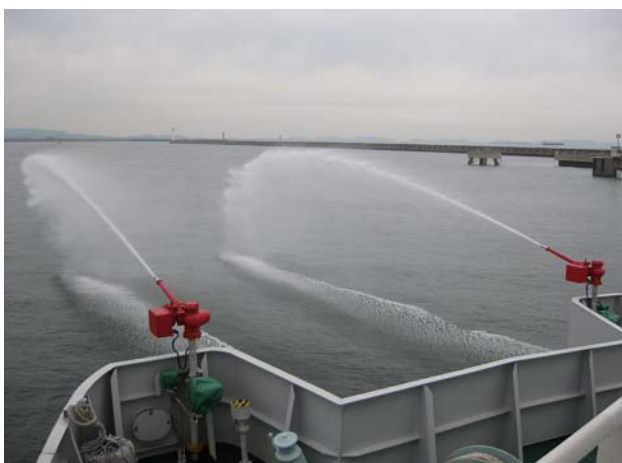
(放水銃による排出油拡散作業)