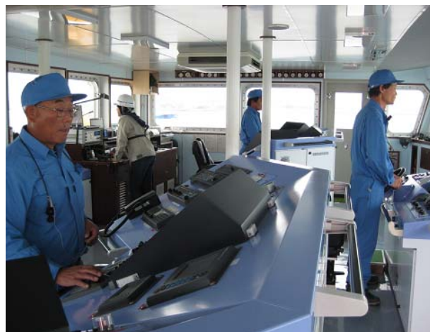
(訓練作業中の操舵室)