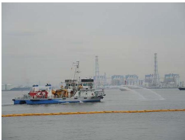
(訓練海域で排出油防除訓練中の白龍)