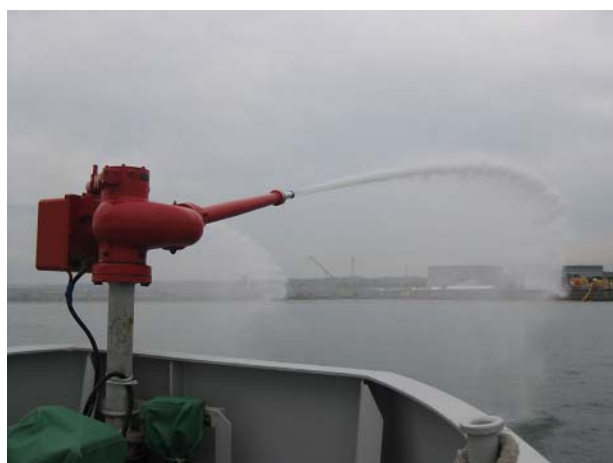
(放水銃 : 最大飛距離約 30m)