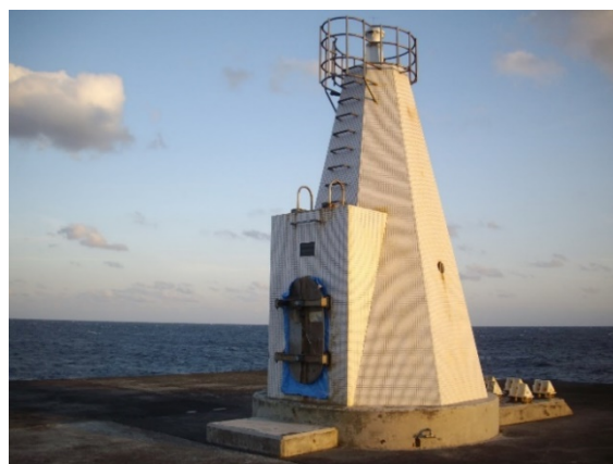
<伊豆大島に設置されている同タイプの灯台>