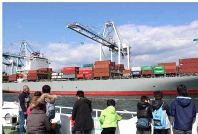
<コンテナ船を見学している様子(平成28年)>

我が国の経済にとって重要な物流機能の強化に加え、クルーズ船等による賑わい空間の創出に向けて動き出すなど新たな「清水港」の魅力を感じて下さい。