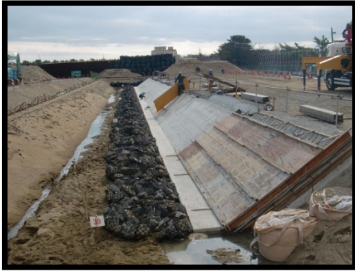
【本体基礎工のイメージ】