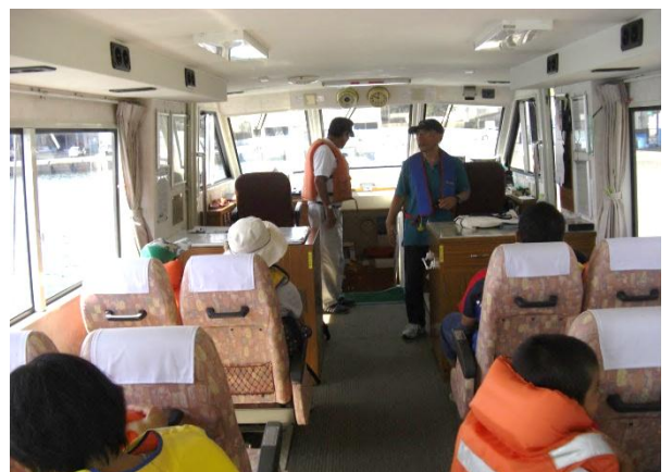
《船による港内見学の様子》