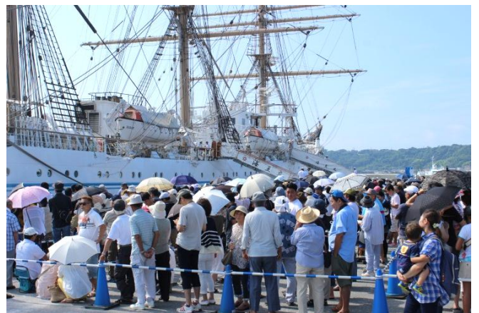
《海王丸一般公開の様子》