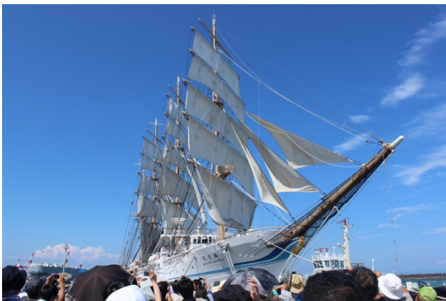
《海王丸セイルドリルの様子》