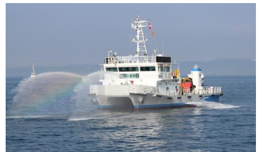
平成27年度 訓練写真

海上訓練は、突発型地震の発生により津波が襲来し、油が海上に流出する等の想定のもと、油回収船機能を有する「白龍」が流出油事故対応を図ることを目的とした海上訓練に参加し、流出油の回収及び航走拡散訓練(流出油防除訓練)を行います。