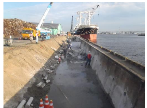
平成27年度 岸壁改良工事