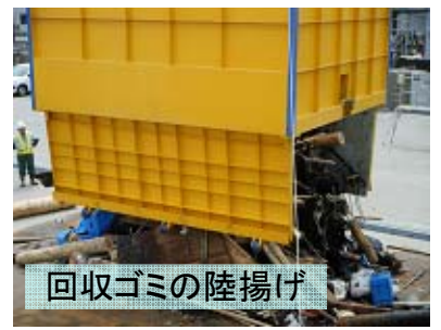
回収ゴミの陸揚げ