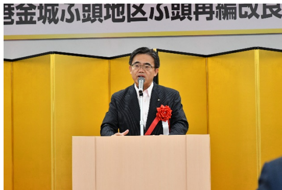
【来賓挨拶】 大村名古屋港管理組合管理者 (愛知県知事)