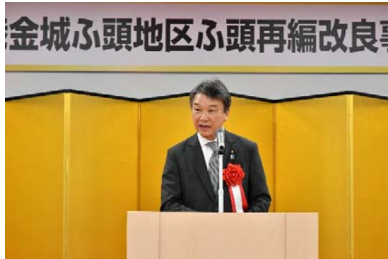
【来賓挨拶】 大野国土交通大臣政務官