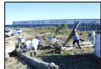
くびしゅう 久々生海岸清掃の様子