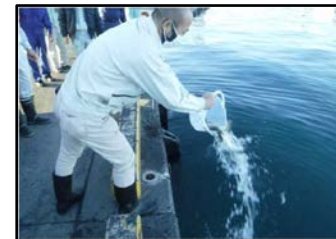
マダイの稚魚放流

御前崎港にある久々生 くびしゅう 海岸には、県のレッドデータブックに準絶滅危惧種と定められるコアマモやアマモ等が自生・群生しており、貴重なCO2吸収源となっています。清水港湾事務所では、2021年に御前崎港の開港50周年 くひしゅう を記念して、アマモ等の『ブルーカーボン』の活用による環境に優しいみなとづくりに向け、久々生海岸の清掃活動を実施しました。当日は2トントラック45台分のゴミを撤去し、清掃後にマダイの稚魚を放流しました。アマモを守り、『ブルーカーボン』を活用することで、環境に優しいみなと作りを目指し、今後も活動を継続していきます。【目標】のべ開催数:2022年度1回 → 2030年度10回