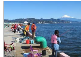
【日の出埠頭岸壁の釣り開放】 年6回ほど開放し、100名程度