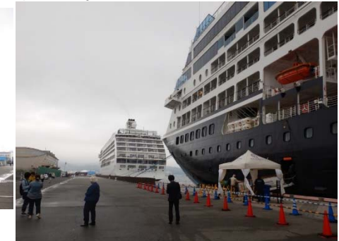
セブンシーズ・マリナー(左) アザマラ・クエスト(右)