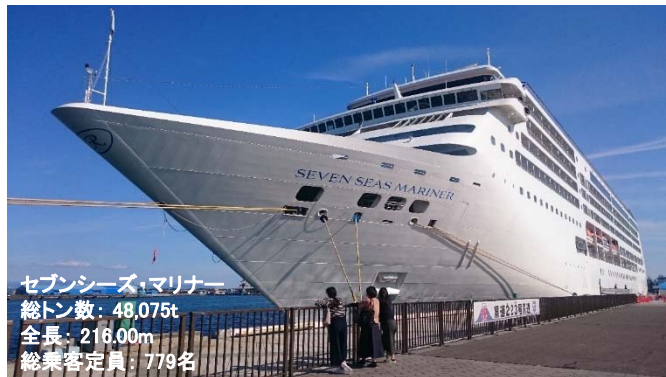
セブンシーズ・マリナー 総トン数：48,075t 全長：216.00m 総乗客定員：779名

リージェント・セブンシーズクルーズ社の「セブンシーズ・マリナー」が4月13日（土）、清水港日の出岸壁に初寄港しました。清水港客船誘致委員会による歓迎式典が開かれました。