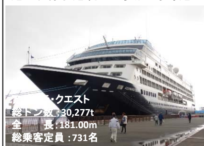
アザマラ・クエスト 総トン数：30,277t 全長：181.00m 総乗客定員：731名

セレブリティクルーズ社の「アザマラ・クエスト」が4月26日（金）、清水港日出岸壁に初寄港しました。当日は、同岸壁に「セブンシーズ・マリナー」、「アザマラ・クエスト」、興津第2埠頭に「ノルウェー・ジュエル」が寄港し、清水港初の3隻同時寄港となりました。