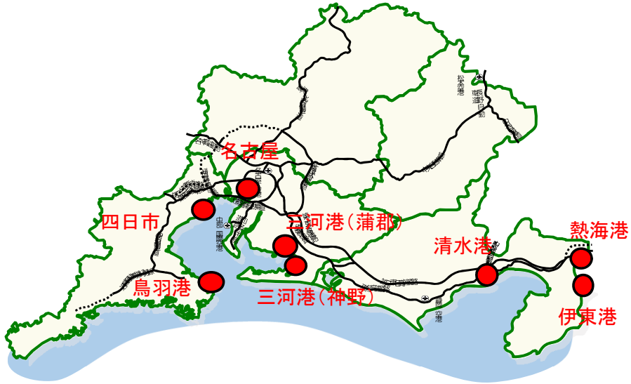
中部地整管内にクルーズ船が寄港あった港の位置図