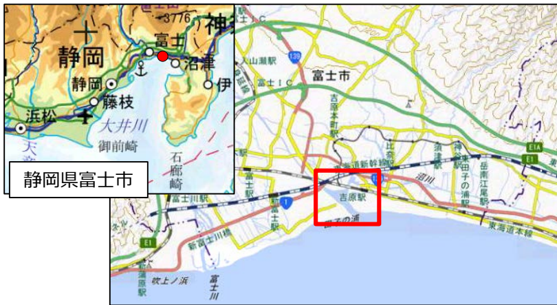
国土地理院地図（電子国土Web）( http://maps.gsi.go.jp )をもとに作成