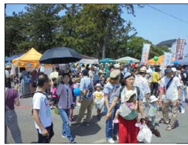
田子の浦みなとマルシェ