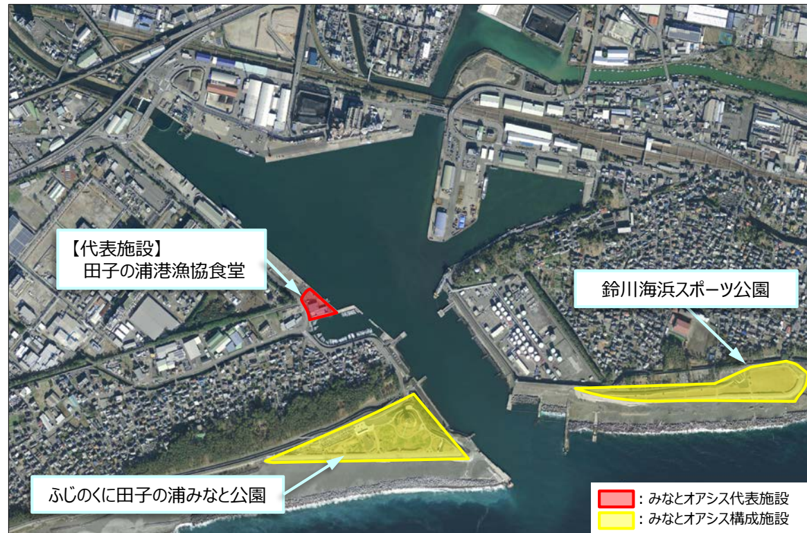
■ : みなとオアシス代表施設 ■ : みなとオアシス構成施設