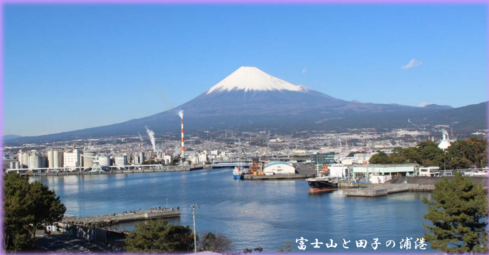
富士山と田子の浦港