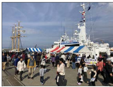
田子の浦ポートフェスタ