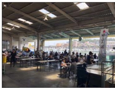
田子の浦港漁協食堂