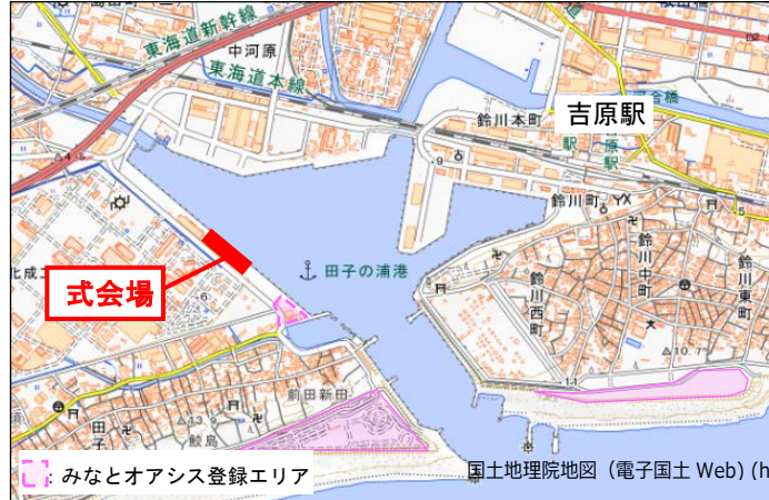
国土地理院地図 (電子国土 Web) ( http://maps.qsi.go.jp )をもとに国土交通省作成

※FAXの場合は到着確認のご連絡をお願い致します。(TEL : 054-352-4148)