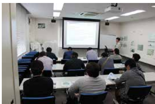
当センターについての説明