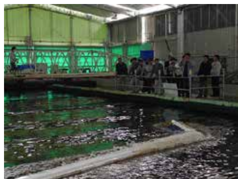
平面水槽での波浪実験の様子