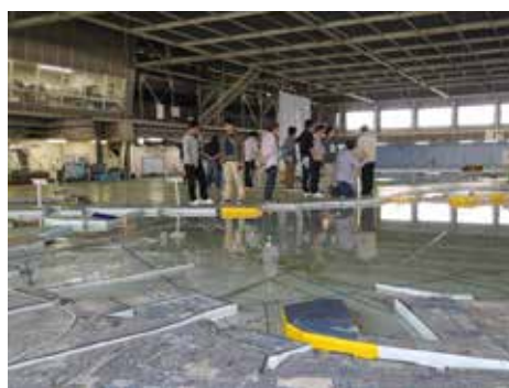
伊勢湾環境水槽 見学の様子