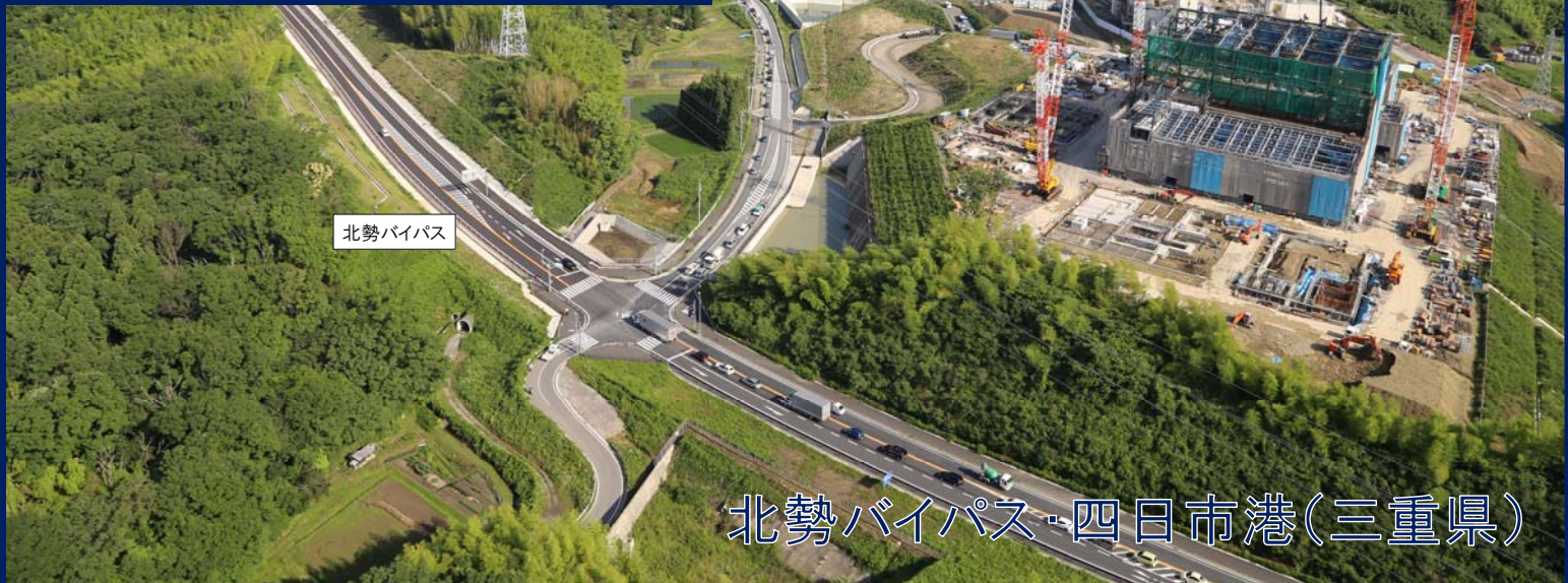
〈立地例〉 東芝四日市工場(第5棟) 竣工:平成26年9月