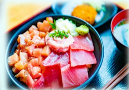
まぐろ丼 (みなとオアシスマぐろのまち清水)