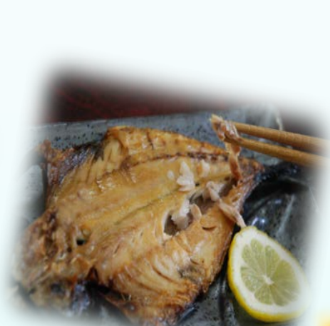
アシの干物 (みなとオアシス沼津)