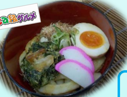
あおさうどん (みなとオアシス志摩)