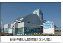
御前崎観光物産館「なぐら館」