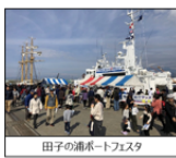
田子の浦ポートフェスタ