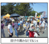
田子の浦みなとマルシェ