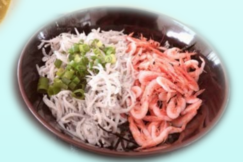
桜えびとしらすの二色釜揚げ丼 (みなとオアシスおおいがわ)