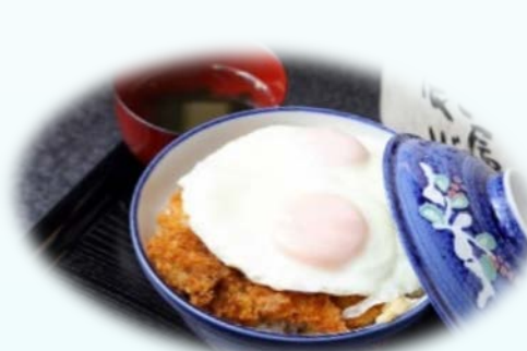
岡田のカツ丼 (みなとオアシスちた新舞子)