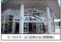
マーケットモール「沿津みなと新鮮館」