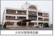
大井川港港湾会館