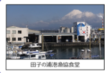
田子の浦港漁協食堂