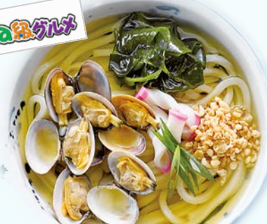
ガマゴリうどん (みなとオアシスがまごおり)