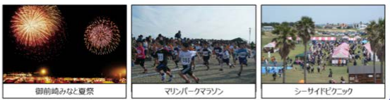
御前崎みなと夏祭