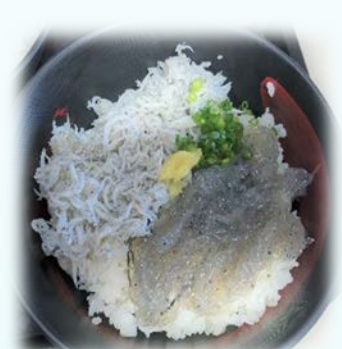
しらす丼 (みなとオアシス田子の浦)