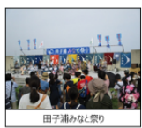
田子浦みなと祭り