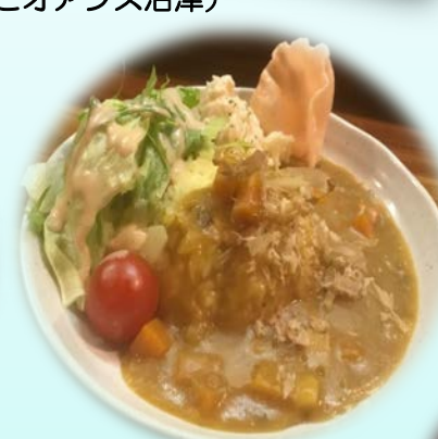
御前崎カレー (みなとオアシス御前崎)