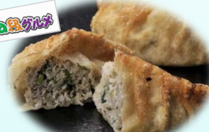
津ぎょうざ (みなとオアシス津なぎさまち)