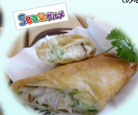
サメ春巻き (みなとオアシスとば)