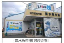
清水魚市場「河岸の市」