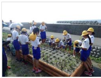
海浜植物の植栽・保護