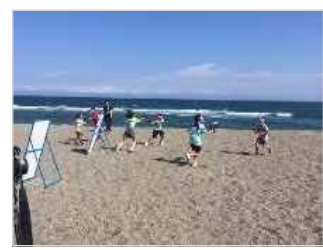
海岸PR活動（水鉄砲大会）