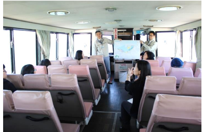
《船による港内視察の様子》