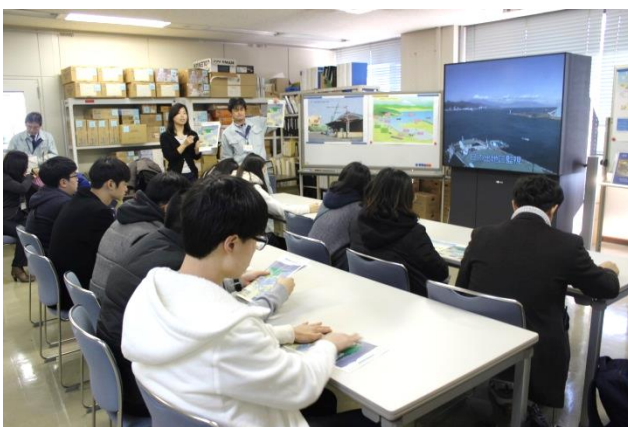
《防災施設視察の様子》