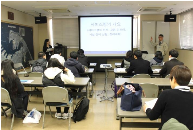
《事務所会議室にて清水港の概要説明の様子》