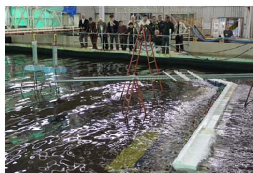
平面水槽での防波堤効果実験の様子