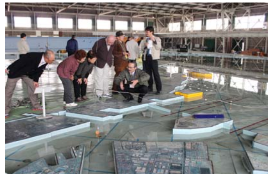
伊勢湾環境水槽での見学の様子