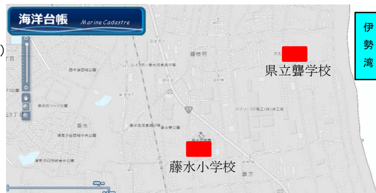
背景図:海上保安庁,国土地理院承認番号平 24 情使、第 916 号