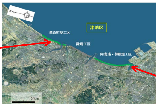
【阿漕浦・御殿場工区】