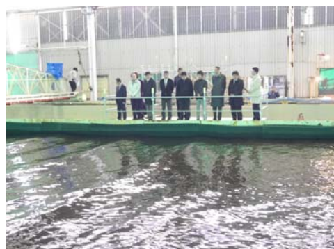
平面水槽での波浪実験の様子