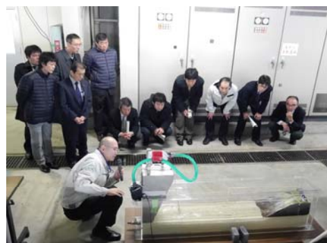
津波実験模型で津波発生メカニズムを見学