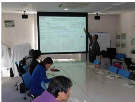
地震・台風災害について学習して頂きました

国土交通省 中部地方整備局 名古屋港湾空港技術調査事務所(伊勢湾水理環境実験センター) 総務課 近藤(こんどう)、水元(みずもと) TEL 052-612-9981 FAX 052-612-9452