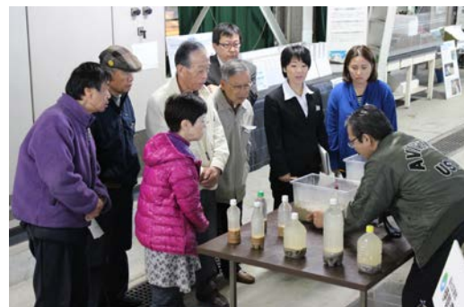
液状化実験装置で液状化発生発生の様子を観察