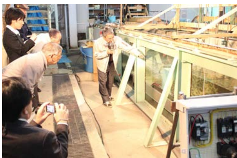
長水路水槽での防波堤断面模型実験の様子