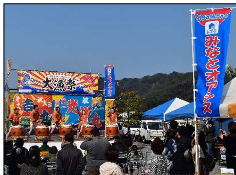
「みなとオアシス」における地域振興イベント