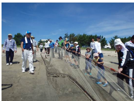
地引網体験の様子