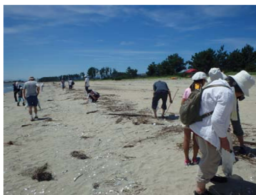
ビーチコーミングの様子