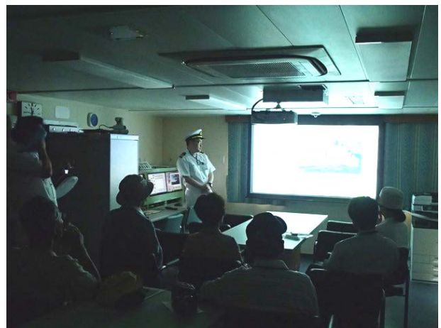
ビデオにて清龍丸を説明する様子