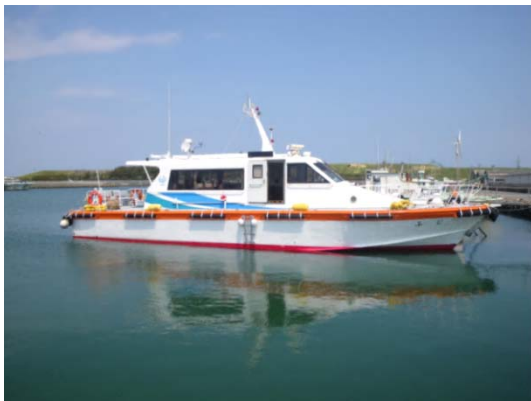
<見学で乗船する港湾業務艇「ふじ」>

「海王丸」に加え、普段は見るのが難しいコンテナターミナルなどの港の施設、整備中の防波堤を船上から見学してみませんか。この企画を通じ地域の方に港の役割などについて理解していただき、港への興味が深まることを期待しています。