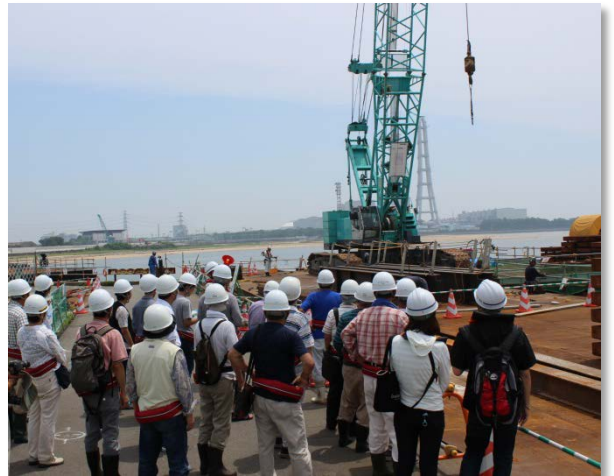
海上施工箇所の見学