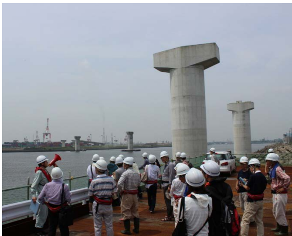
海上に並ぶ霞4号幹線橋脚群を眺めて