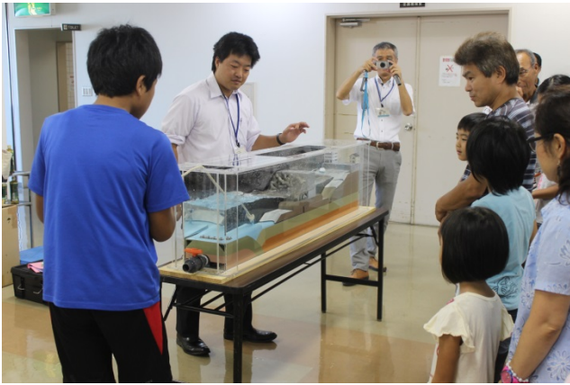
<港湾施設（防波堤）の効果実験①>