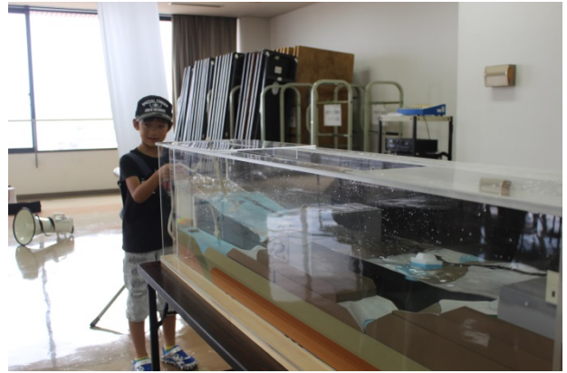
<港湾施設（防波堤）の効果実験②>