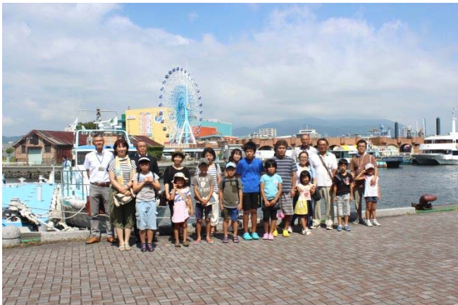
8/19 親子見学会記念撮影

また、主催者である一般社団法人清水建設業協会からは「港湾施設の重要性とともにその建設に貢献していること」「建設業がこの地域に果たしている役割」などが説明され、港内の港湾施設の機能や港の役割、建設業への理解が深まった良い取り組みとなりました。