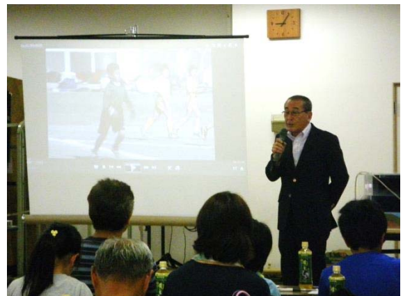
主催者挨拶（一社）清水建設業協会 会長