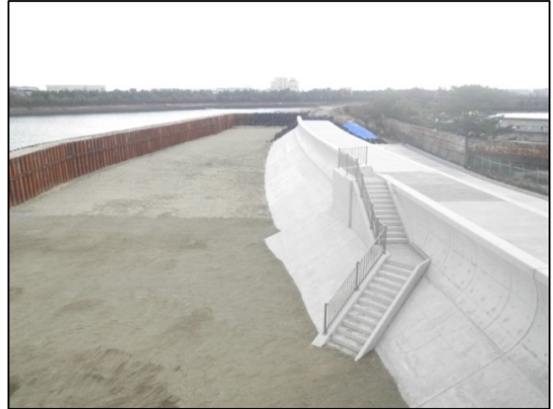
改良後の海岸堤防(完成済み区間)