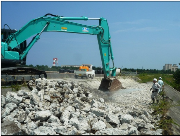
老朽化した海岸堤防の撤去状況