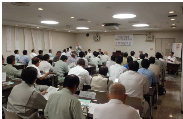
「工事安全大会」聴講状況