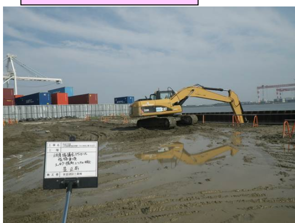
【是正前：土砂掘削範囲の明示】