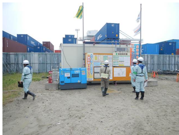
パトロールの実施状況

平成28年6月20日(月)に中部地方整備局、三河港湾事務所及び受注者の職員合わせて12名により、神野地区耐震強化岸壁の工事現場で不安全な行動や危険な作業環境がないかを確認するため、安全パトロールを実施しました。