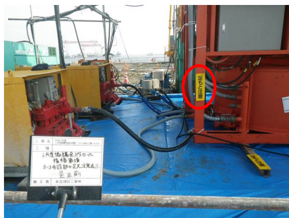
【是正後：ホース布設部の注意喚起明示】

今回、安全パトロールを実施した工事は、本格的に施工を開始したところであり、今後は高温高湿度の作業環境になっていきます。そのため、熱中症等作業員の健康管理にも配慮しながら工事現場の安全対策に取り組んでまいります。