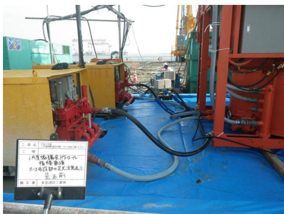
【是正前：ホース布設部の注意喚起明示】