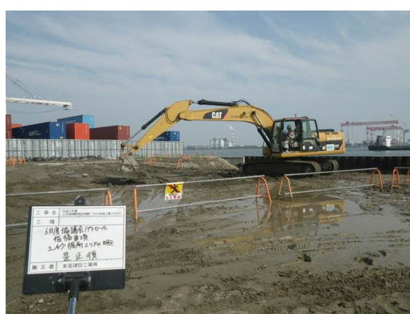
【是正後：土砂掘削範囲の明示】