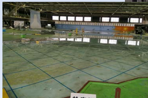
伊勢湾水理模型実験センター

名古屋港湾空港技術調査事務所 名古屋市中区東又兵衛町1丁目57-3 ★JR東海道本線 笠寺駅から徒歩10分