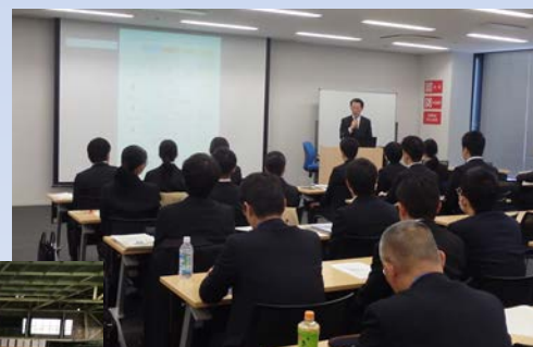
昨年度の意見交換会

申し込み・お問い合わせ先 港湾空港部港湾事業企画課(鈴木) TEL:052-209-6324