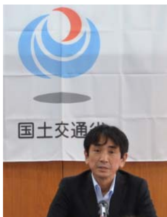
長谷川中部地方整備局副局長