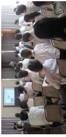
竹の間 (地域との協働)