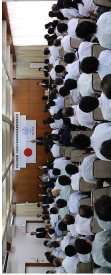
松の間 開会式、特別講演、表彰式 (生産性向上、新技術活用)