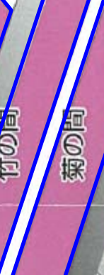
菊の間 (ポスターセッション)