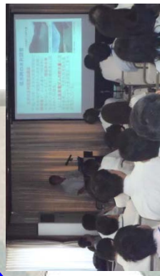
富士桜 (働き方改革)